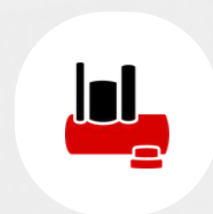
Coletores à medida