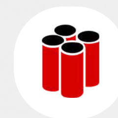
Pré Fabrico em Aço Inox